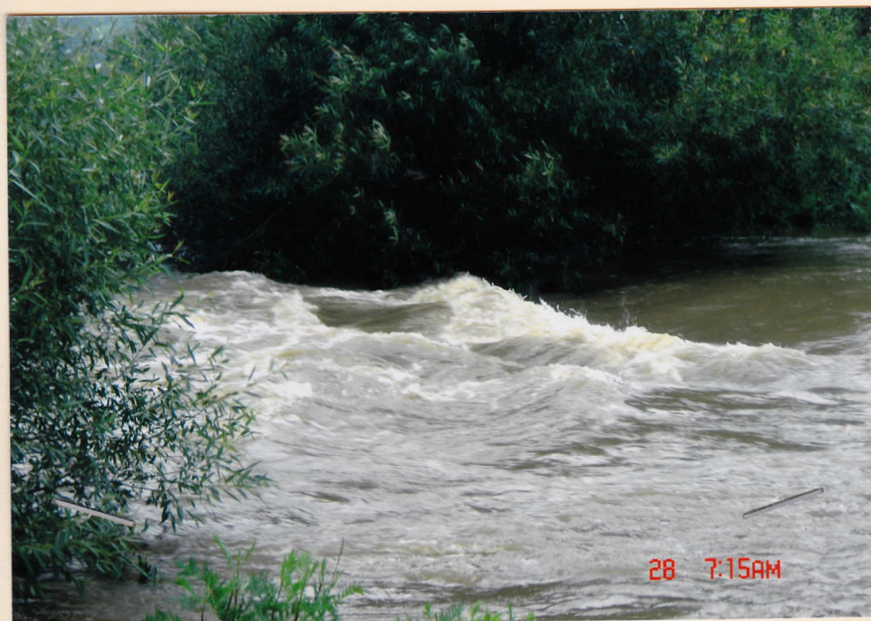
ČERVENOVÁ POVODĚNÍ „MAPÁCKÝ JEZ“

NĀŠ ROZPOČET - DO ROKU 2011 SE SNAŽÍME VEJÍT Z VYROVNANÝM ROZPOČTEM